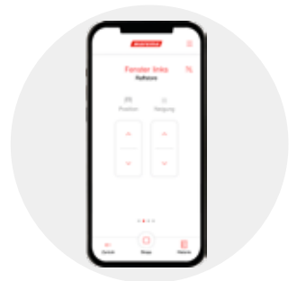
Für anspruchsvolles Wohnen: Omnexo

Die Wisotronic ist ein intelligentes Steuerungssystem mit integriertem Temperatursensor in der Bedienzentrale. Sie ist für alle WAREMA Produkte geeignet und sorgt vollautomatisch für ein angenehmes Raumklima und ein behagliches Wohnumfeld. Mit der Wisotronic können alle Sonnenschutzprodukte einer Fassadenseite gleichzeitig bedient werden. Dafür stehen bis zu 4 Kanäle (1 Kanal pro Fassadenseite) zur Verfügung.