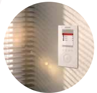
Geniale Funktionalität: Wisotronic